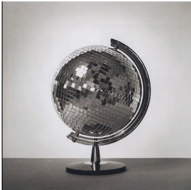
Chema Madoz S-T Robert Klein Gallery

Descrivi els elements icònics d'aquesta imatge. Com interpretes aquesta imatge? Raona la resposta. Suggereix un títol adequat per a aquesta imatge. (4 punts)