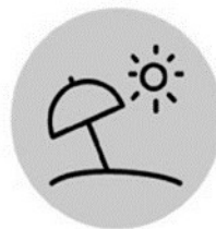
Extensió de la temporada turística de sol i platja