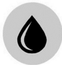
Afectació a la disponibilitat de recursos (aigua i energia)