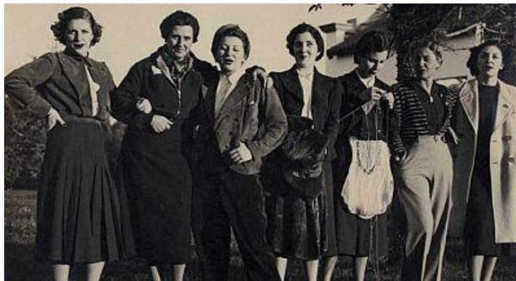
Imagen de Las Sinsombrero.