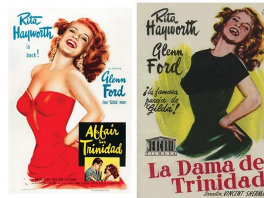
Fuente: Censura del cartel de la película La Dama de Trinidad, 1952.