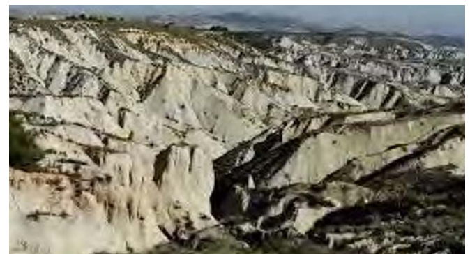
Barrancos de Gebar, Librilla (Murcia)