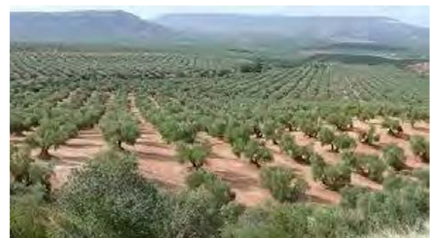
Paisaje de la campiña del Guadalquivir