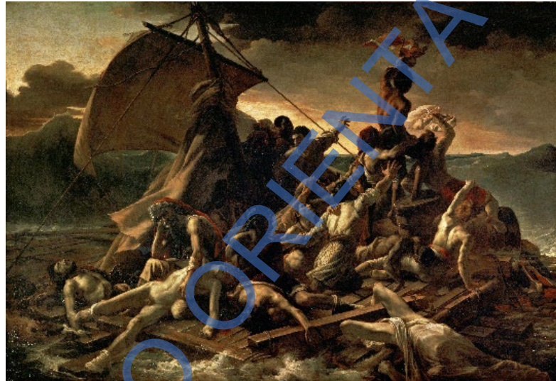
Lámina 1: GERICAULT, La balsa de la Medusa .