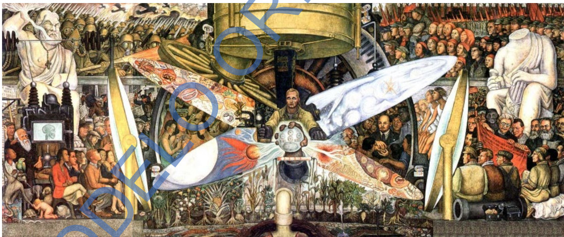
Lámina 4: El hombre controlador del universo.