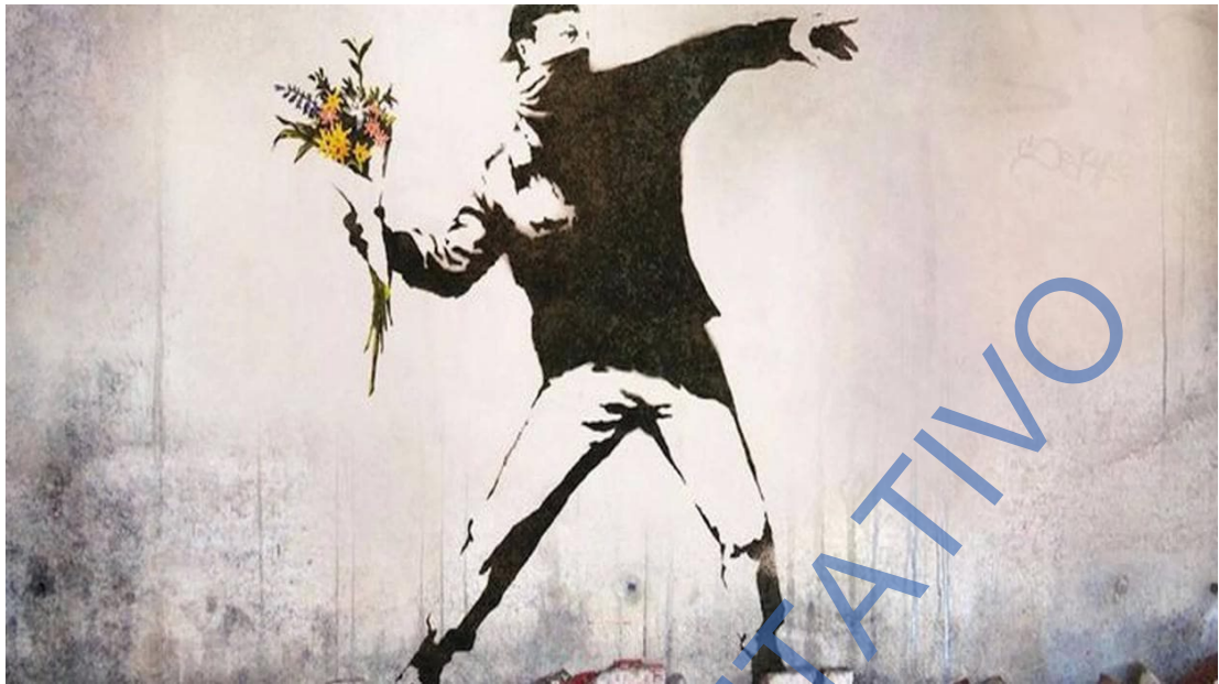
Lámina 3: BANKSY, El lanzador de flores.

5.-Comente una de las siguientes láminas: