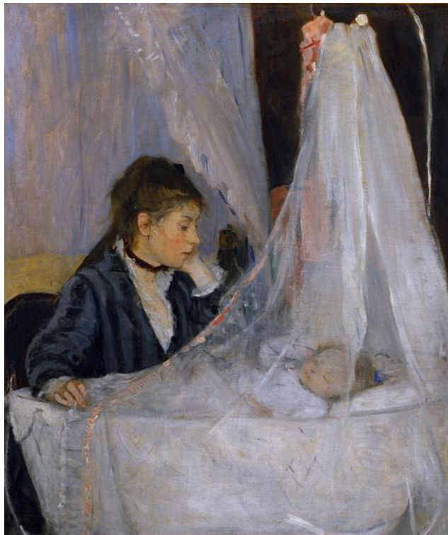
Obra 1: Berthe Morisot, El bressol , 1872. Oli sobre tela, 56 x 46 cm. Musée d'Orsay, París./ Berthe Morisot, La cuna , 1872. Óleo sobre tela, 56 x 46 cm. Musée d'Orsay, París.