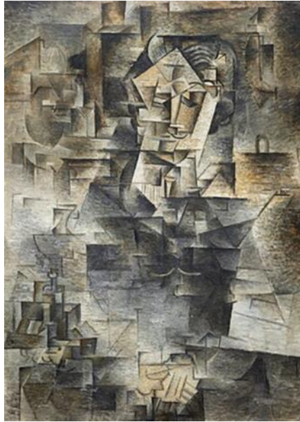
Pablo Picasso: Retrato de Daniel-Henry Kahnweiler (1910)