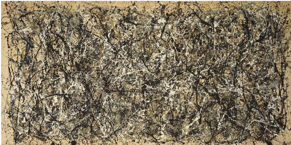
Jackson Pollock: Number 31 (1950)