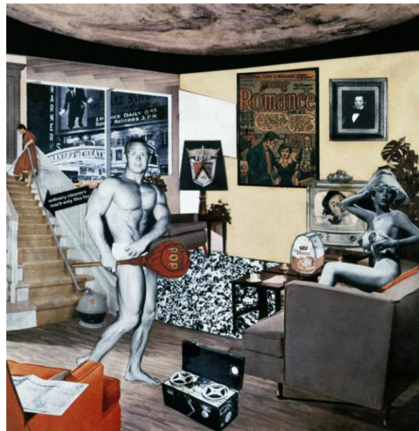
Figura A2. Richard Hamilton, Què és el que fa que les llars d'avui en dia siguin tan diferents, tan atractives? , 1956

OPCIÓ B. Analitza aquestes dues pintures i explica de quina manera l'obra d'El Greco marca la d'Ernst Ludwig Kirchner.