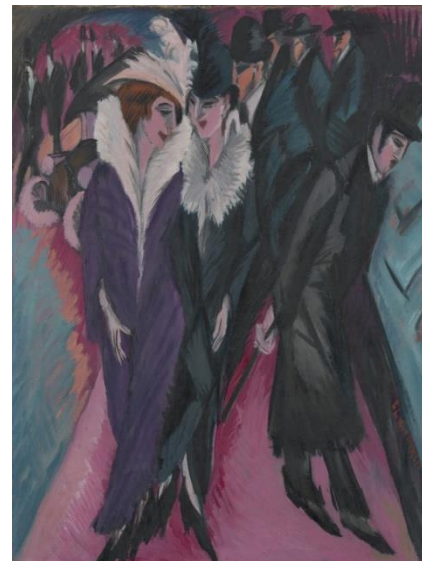
Figura B2. Ernst Ludwig Kirchner, Escena de carrer. Berlín , 1913