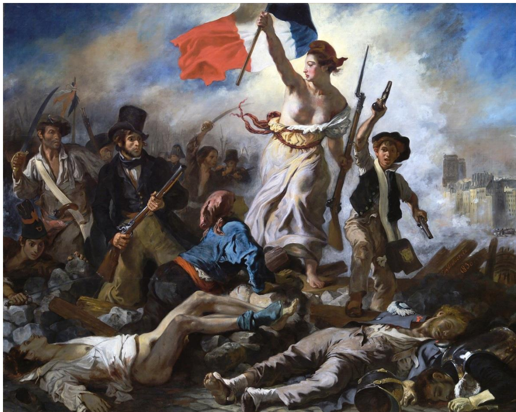
Figura 3. Eugène Delacroix, La Llibertat guiant el poble , 1830