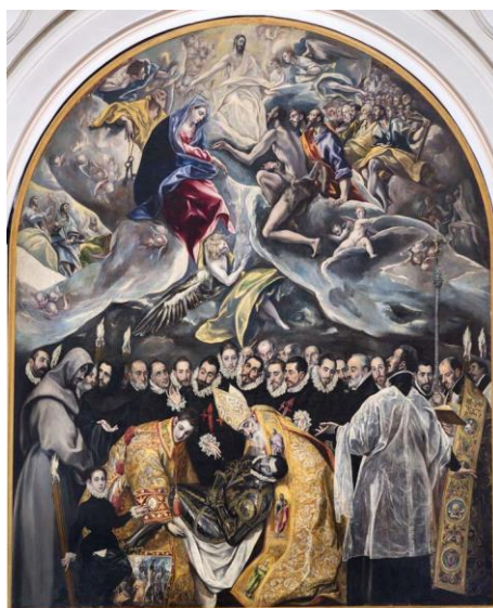
Figura B1. El Greco, L'enterrament del senyor d'Orgaz , 1586

OPCIÓ B. Analitza aquestes dues pintures i explica de quina manera l'obra d'El Greco marca la d'Ernst Ludwig Kirchner.