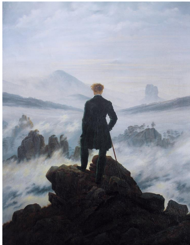
Figura 1. Caspar D. Friedrich, El caminant damunt el mar de boira , 1817