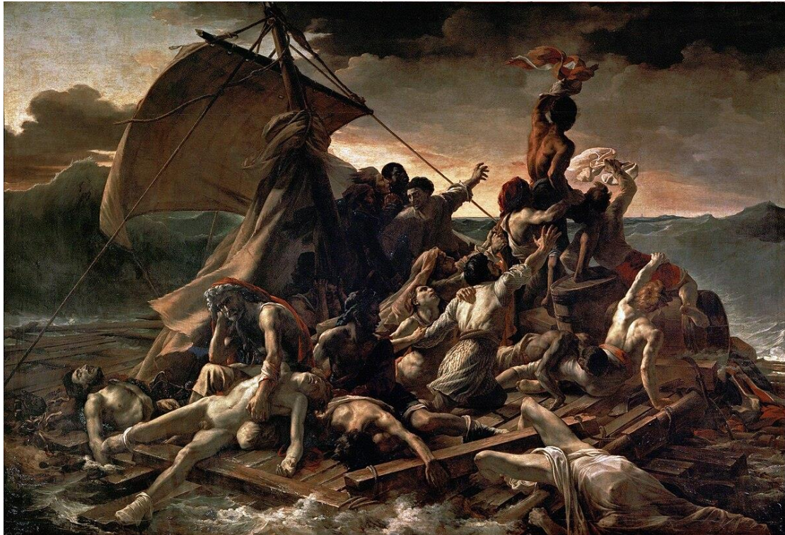
Figura 2. Théodore Géricault, Rai de la «Medusa» , 1819