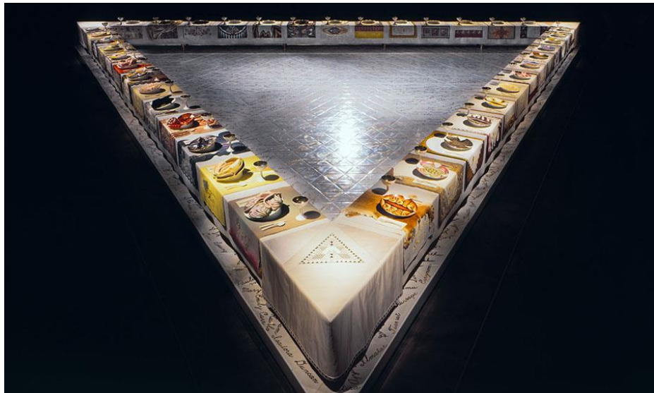
Judy Chicago, The Dinner Party, 1974-1979

El comentari pot començar amb la descripció de l'obra per després explicar-ne el context o iniciar-se amb el context per després centrar-se en l'obra.