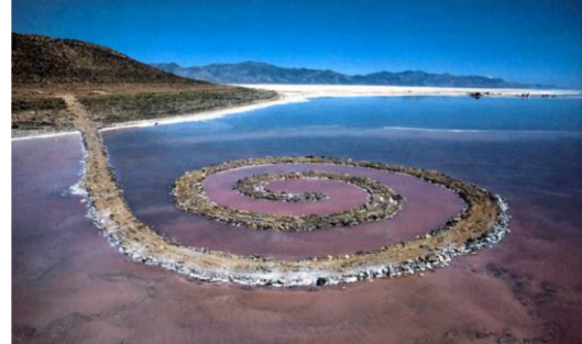
B. Robert Smithson, Spiral Jetty , 1970