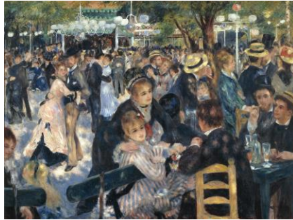
A. Pierre-Auguste Renoir, Ball al Moulin de la Galette , 1876

Opció 2.b. Si has escollit l'art natura, has d'explicar la idea d'obra com a intervenció efímera o vinculada al lloc, i la seva crítica a la societat de consum i als circuits tradicionals del món de l'art.