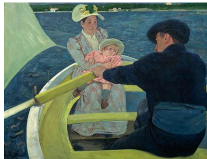
C. Mary Cassatt, The Boat Party (El grup de la barca) , 1893