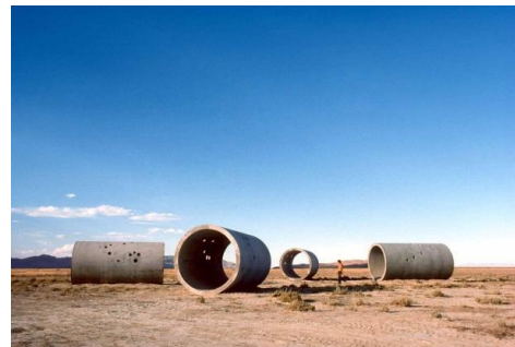
D. Nancy Holt, Túnel solars , 1973-1976