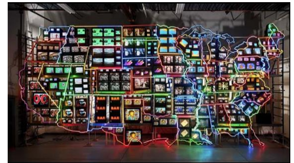
Superautopistas electrónicas... (1995) Autor: Nam June Paik

Pregunta 8 Identifique el movimiento artístico al que pertenecen estas dos obras, explique sus principales características, su contexto histórico y social. Analice las similitudes y diferencias morfológicas (técnica, elementos básicos, iconicidad, composición y centros de interés) entre ambas obras (2 puntos)