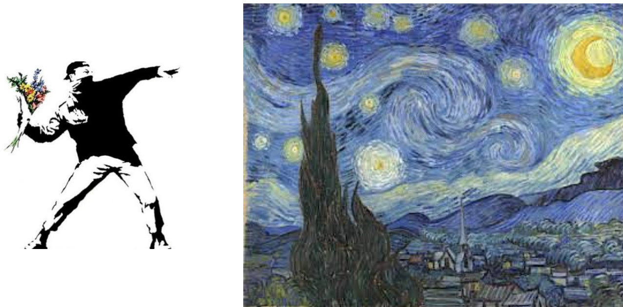
Fig.1: Flower Thrower (Jerusalén, 2003) Autor: Banksy

Pregunta 6 (Fig.2) Identifique el movimiento al que pertenece esta obra, explique sus principales características morfológicas (técnica, elementos básicos, iconicidad, composición y centros de interés). Explique su contexto histórico y el contexto personal en que el autor realiza la obra (2 puntos)