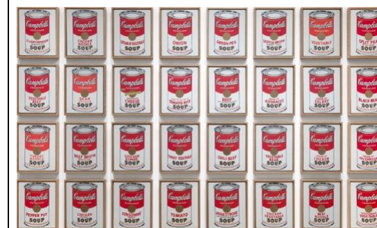
Latas sopas Campbell (1962)

Pregunta 8 Identifique el movimiento artístico al que pertenecen estas dos obras, explique sus principales características, su contexto histórico y social. Analice las similitudes y diferencias morfológicas (técnica, elementos básicos, iconicidad, composición y centros de interés) entre ambas obras (2 puntos)