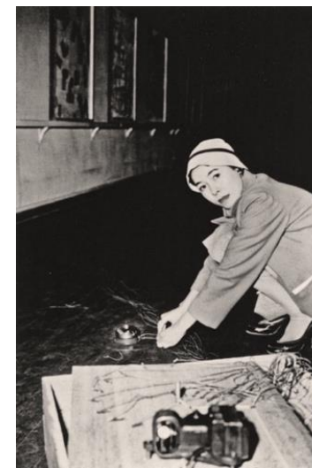
Bell (1955) Autora: Atsuko Tanaka.

Pregunta 7 Identifique el movimiento o lenguaje artístico al que pertenecen estas dos obras, explique sus principales características, su contexto histórico y social. Analice la evolución del movimiento entre ambas obras (2 puntos)