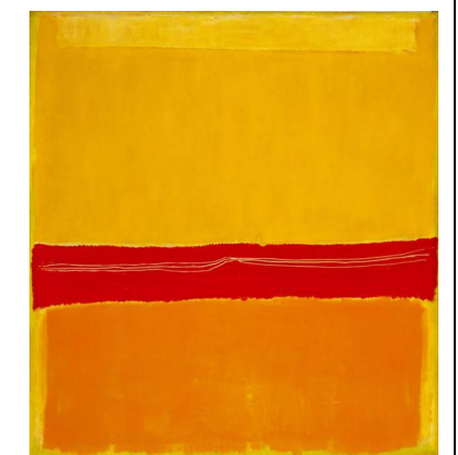
Pregunta 8 (Fig. b)