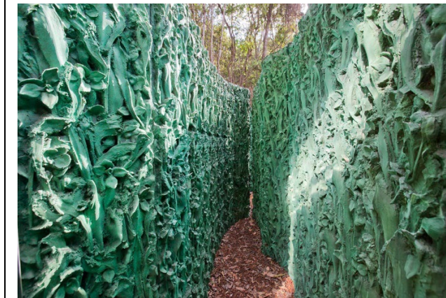
Pregunta 7 (Fig. a)