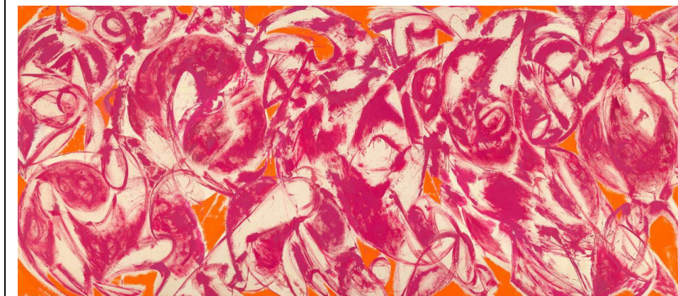
Pregunta 8 (Fig. a)