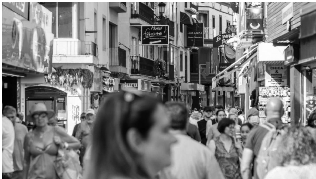
Eje comercial turístico en Benidorm (Alicant)