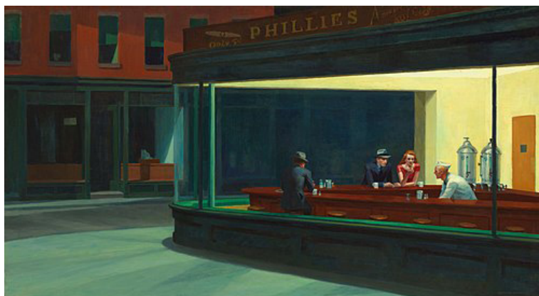
IMAGEN B. Nighthawks («Noctámbulos») Óleo sobre lienzo, 84,1 × 152,4 cm.