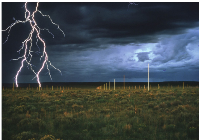
IMAGEN C. The lightning field («Campo de relámpagos»). Instalación formada por cuatrocientos postes de acero inoxidable dispuestos formando una cuadrícula de 1,6 × 1 kilómetros, ubicados en el condado de Catron, Nuevo México.

1.1. Rellene la siguiente tabla dando la datación aproximada de cada obra (indicando la década de creación). Escriba también a qué movimiento y a qué artista (o artistas) pertenece cada una. [0,75 puntos]