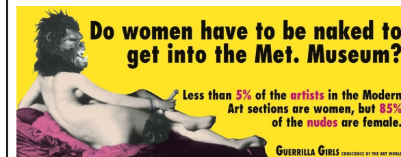
GUERRILLA GIRLS, Do women have to be naked to get into the Met. Museum? , 1989

Do women have to be naked to get into the Met. Museum? de las Guerrilla Girls y el tratamiento de género en el arte.