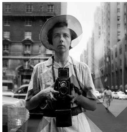
VIVIAN MAIER, Autorretrato , sin fecha

En 10-12 líneas, compara estas dos obras desde el punto de vista del tema y significado (afinidades y diferencias).