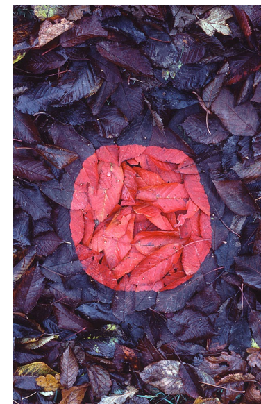
ANDY GOLDSWORTHY, 1984_158 , 1984

1984_158 de Goldsworthy y la exaltación del medio natural.