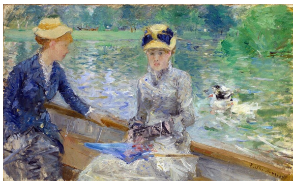
OPCIÓN B: BERTHE MORISOT, Día de verano , 1879