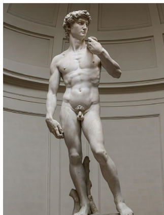
OPCIÓN A: MICHELANGELO BUONARROTTI (MIGUEL ÁNGEL), David , 1501-1504