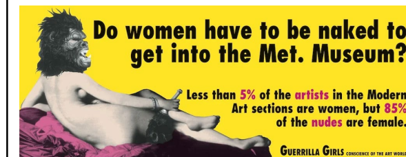
GUERRILLA GIRLS, Do women have to be naked to get into the Met. Museum? , 1989

Guerrilla Girls-en Do women have to be naked to get into the Met. Museum? eta generoaren trataera artean