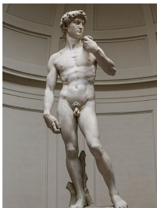
A AUKERA: MICHELANGELO BUONARROTTI, David , 1501-1504