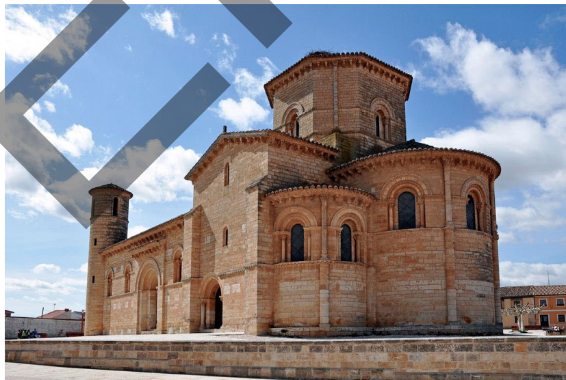
San Martín de Frómi