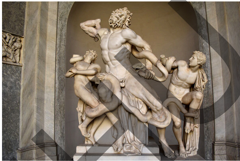
Laocoonte y sus hijos

Son cuatro imágenes a analizar y se eligen dos.