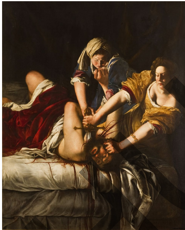
Artemisia Gentileschi. Judith decapitando a Holofernes