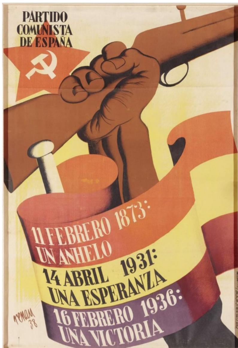
Josep Renau, 1938. Litografía sobre paper Imatge a sang 99 x 69 cm. Art gràfic. Museu Nacional Centro de Arte Reina Sofia Josep Renau, 1938. Litografía sobre papel, Imagen a sangre: 99 x 69 cm. Arte gráfico. Museo Nacional Centro de Arte Reina Sofia

Análisis y comentario de una obra, con los siguientes apartados: contexto y estilo al que pertenece la obra y características de dicha obra en relación a este estilo; autor, obra y estilo personal; análisis descriptivo formal y técnico: composición, color, espacio, luz, texturas, formas, aspectos técnicos, líneas...; análisis iconográfico e iconológico: significado de la obra y repercusión en su momento; y antecedentes e influencias posteriores.