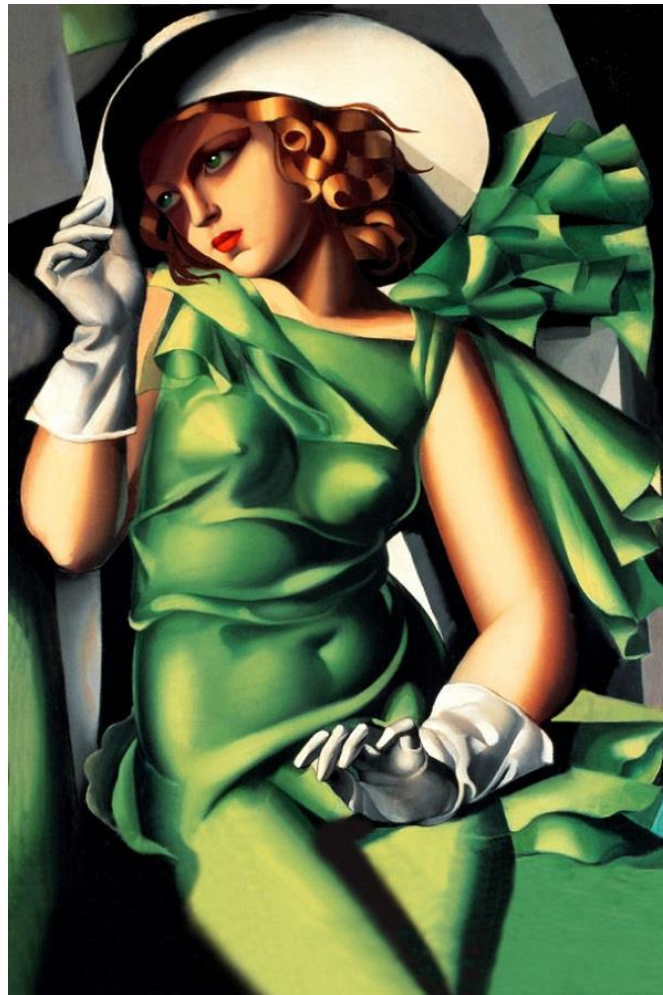
Tamara Lempicka Muchacha con guantes , 1930 Oli sobre llenç / óleo sobre lienzo. Centro Pompidou, París (Art Decó)

Análisis y comentario de una obra, con los siguientes apartados: contexto y estilo al que pertenece la obra y características de dicha obra en relación con este estilo; autor, obra y estilo personal; análisis descriptivo formal y técnica: composición, color, espacio, luz, texturas, formas, aspectos técnicos, líneas...; análisis iconográfico e iconológico: significado de la obra y repercusión en su momento; y antecedentes e influencias posteriores.