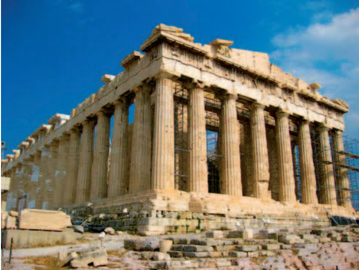
IMATGE 1 / IMAGEN 1 Imatge 1. El Partenó. Acròpolis d'Atenes. Segle V a.C.

Imagen 1. El Partenón. Acrópolis de Atenas. Siglo V a.C.