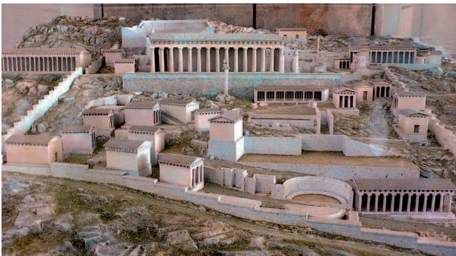
Imagen 3. Reproducción del Santuario de Apolo en Delfos.