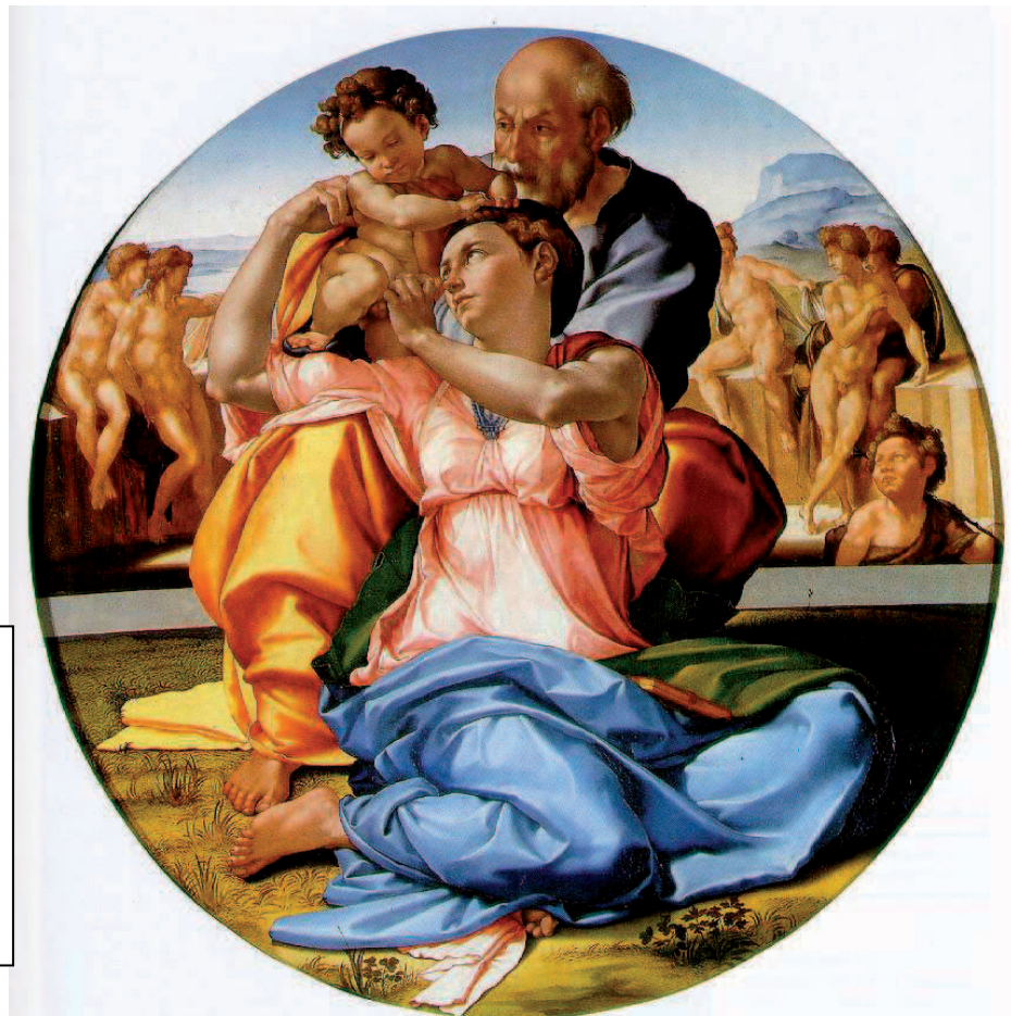
IMATGE 2 / IMAGEN 2

Imagen 1. La creación de Adán. Techo de la Capilla Sixtina, Vaticano. Miguel Ángel, 1510-11.