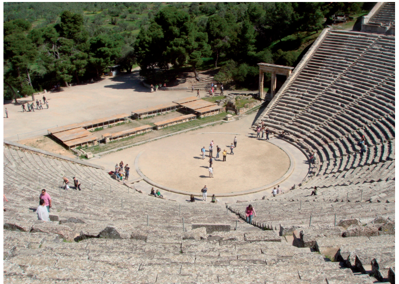
IMATGE 3 / IMAGEN 3 Imatge 3. Reproducció del santuari d'Apol·lo a Delfos.

Imagen 2. Teatro de Epidauro. Siglo IV a.C.