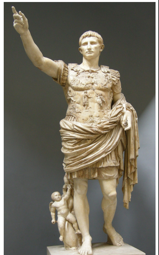
Imagen 3: Augusto de Prima Porta. Finales del s.I a.C.-principios del s. I d.C.

Imatge 3: August de Prima Porta. Fins del s.I a.C.-principis del s.I d.C.