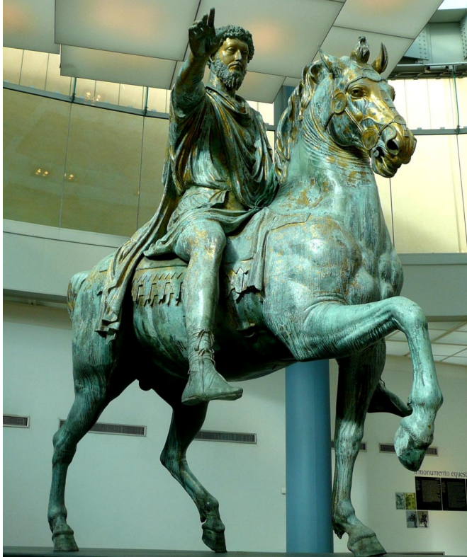
IMATGE 1 / IMAGEN 1

Imatge 1: Estàtua eqüestre de Marc Aureli. 176 d.C.