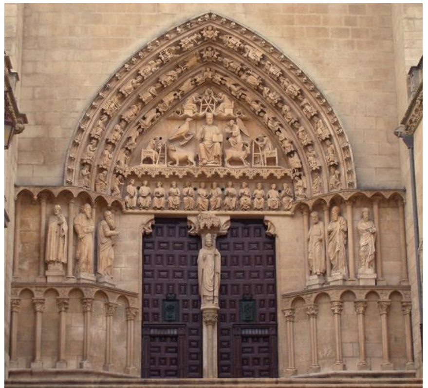
Imagen 2: Pórtico del Sarmental. Catedral de Burgos. Siglo XIII.

Imatge 2: Pòrtic del Sarmental. Catedral de Burgos. Segle XIII.