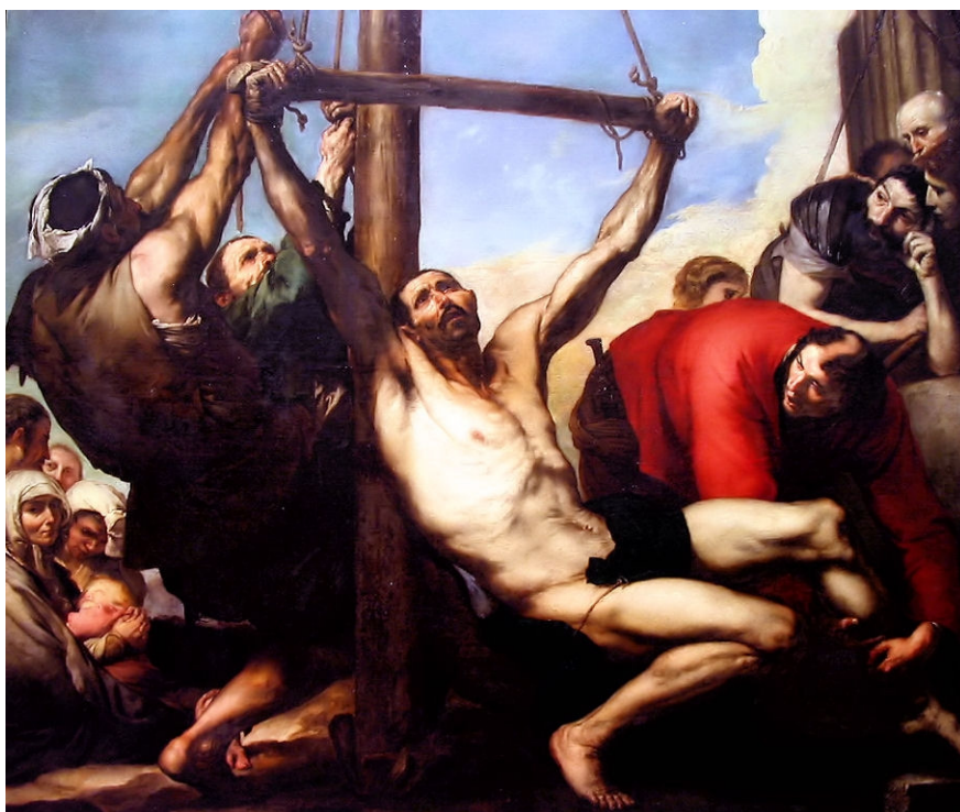
Imagen 2: El martirio de San Felipe. 1639. José Ribera.

Imatge 2. El martiri de Sant Felip. 1639. José Ribera.