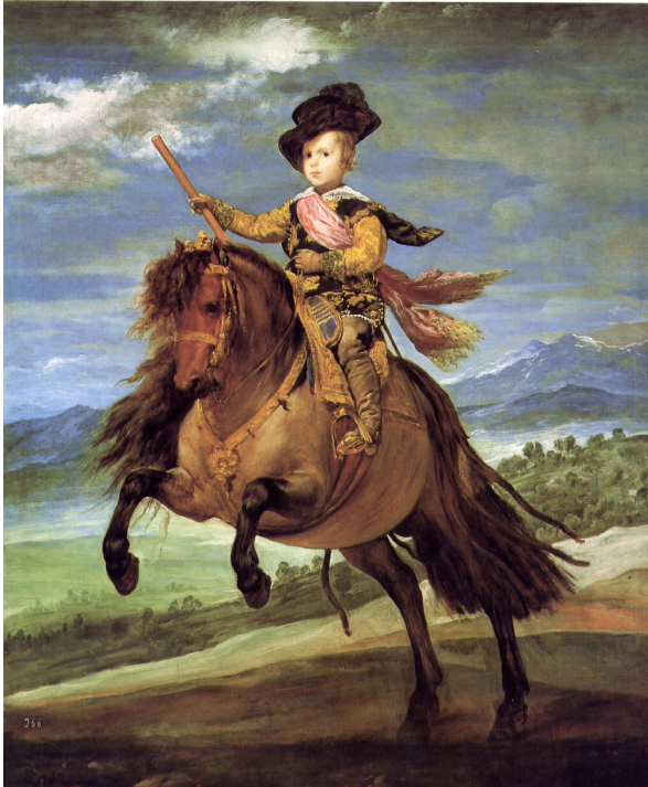
IMATGE 1 / IMAGEN 1

Imatge 1. El príncep Baltasar Carlos a cavall. 1634-35. Diego Velázquez.