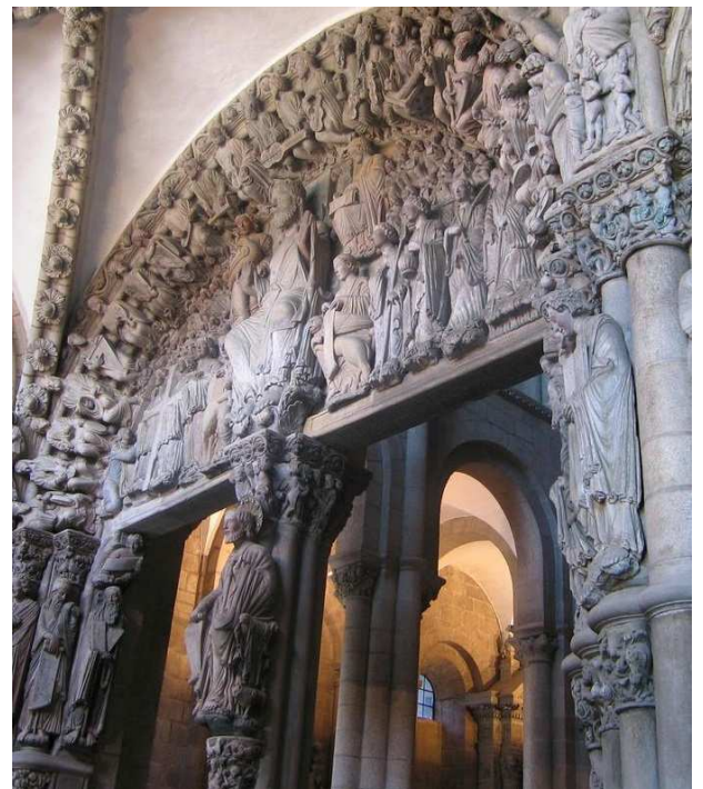
Imagen 3. Pórtico de la Gloria , Catedral de Santiago de Compostela. 1168-1188. Maestro Mateo

Imatge 3. Pòrtic de la Gloria , catedral de Santiago de Compostel·la. 1168-1188. Mestre Mateo