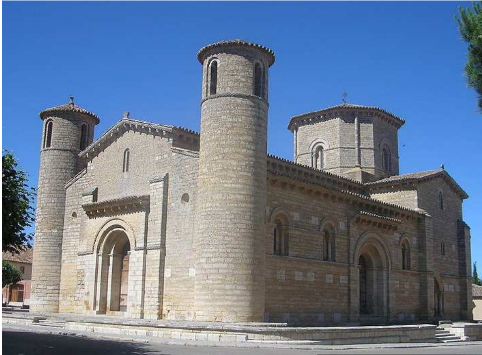
IMATGE 1 / IMAGEN 1

Imatge 1. Sant Martí de Frómista , (Palència). Segles XI-XII