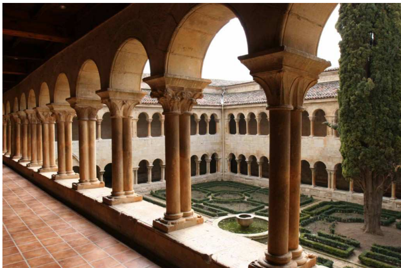
IMATGE 3 / IMAGEN 3

Imagen 2. Claustro de Santo Domingo de Silos (Burgos). Siglos XI-XII