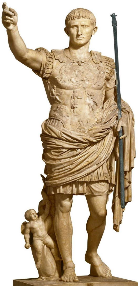
IMATGE 1 / IMAGEN 1

EXERCICI B / EJERCICIO B JULIOL 2017 / JULIO 2017