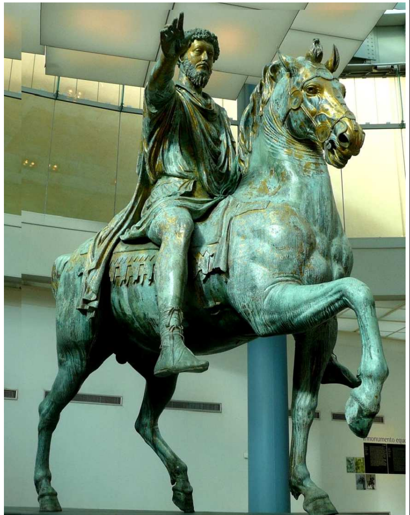
IMATGE 2 / IMAGEN 2

Imagen 1. Augusto de Prima Porta. Museos Vaticanos. Siglo I d.C.