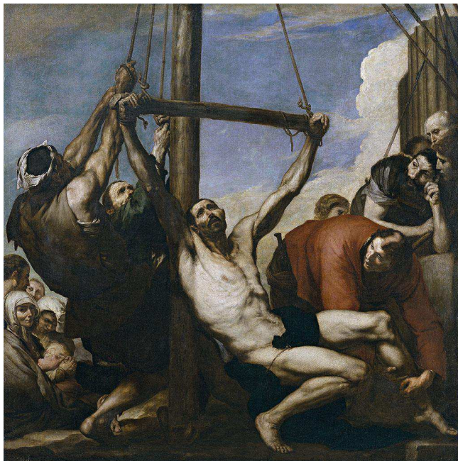
Imagen 1: Martirio de San Felipe. José de Ribera. 1639.

Imatge 1: Martiri de Sant Felip. Josep de Ribera. 1639.