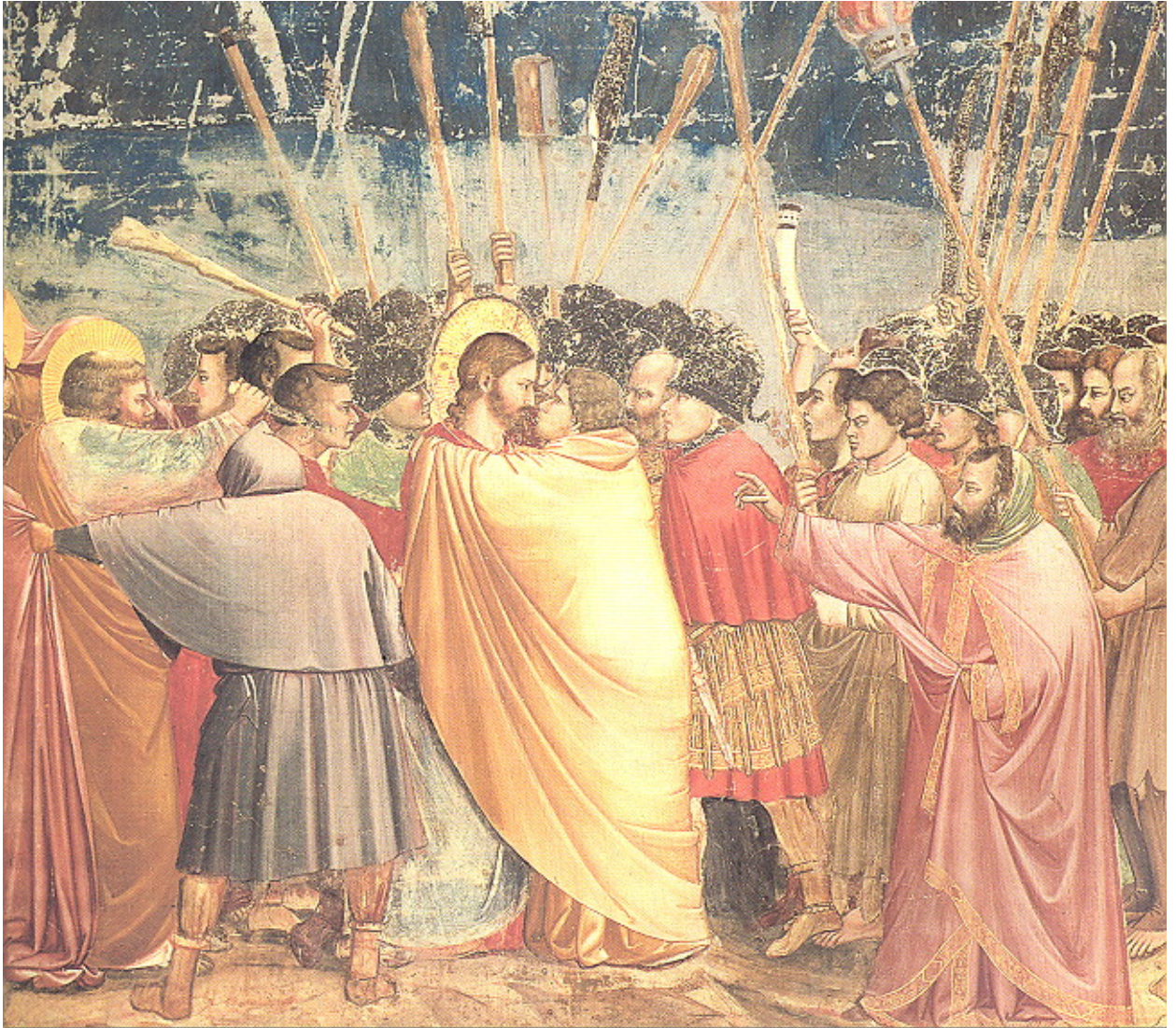
Imagen 3. Giotto: Beso de Judas, Capilla de los Scrovegni