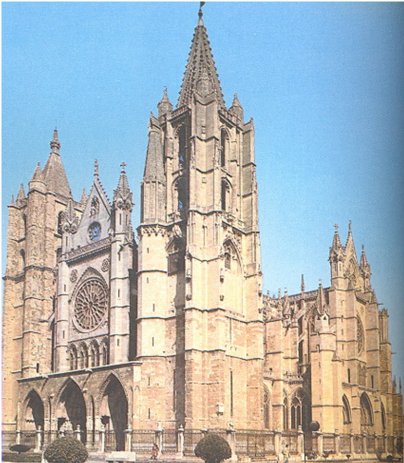
Imagen 1. Catedral de León.