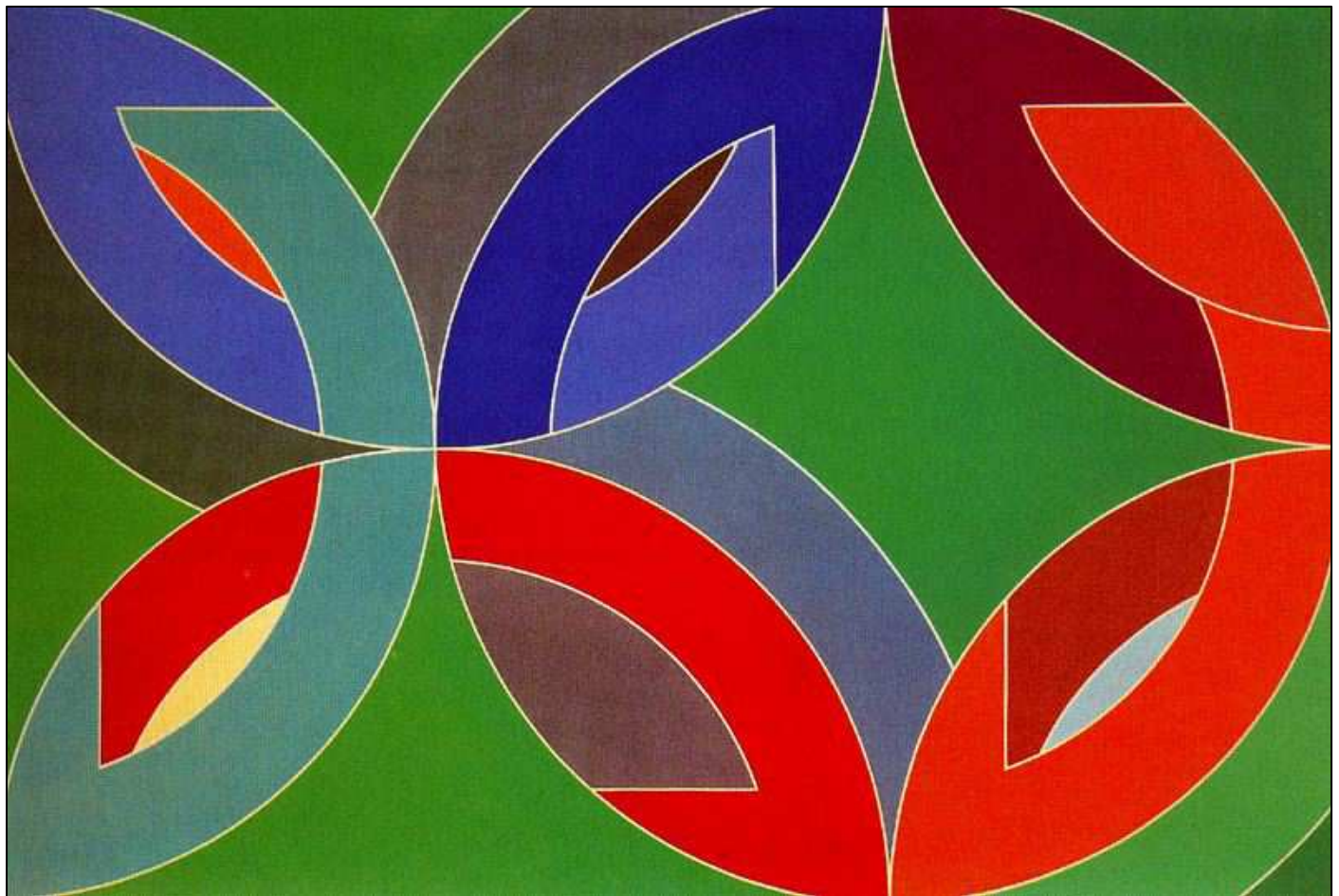
Frank Stella (1936)

Interpretar esta obra o un fragmento de ella utilizando una técnica mixta, alterando el color de la composición. El soporte debe tener un tamaño DIN A4 y adecuarse a la técnica.