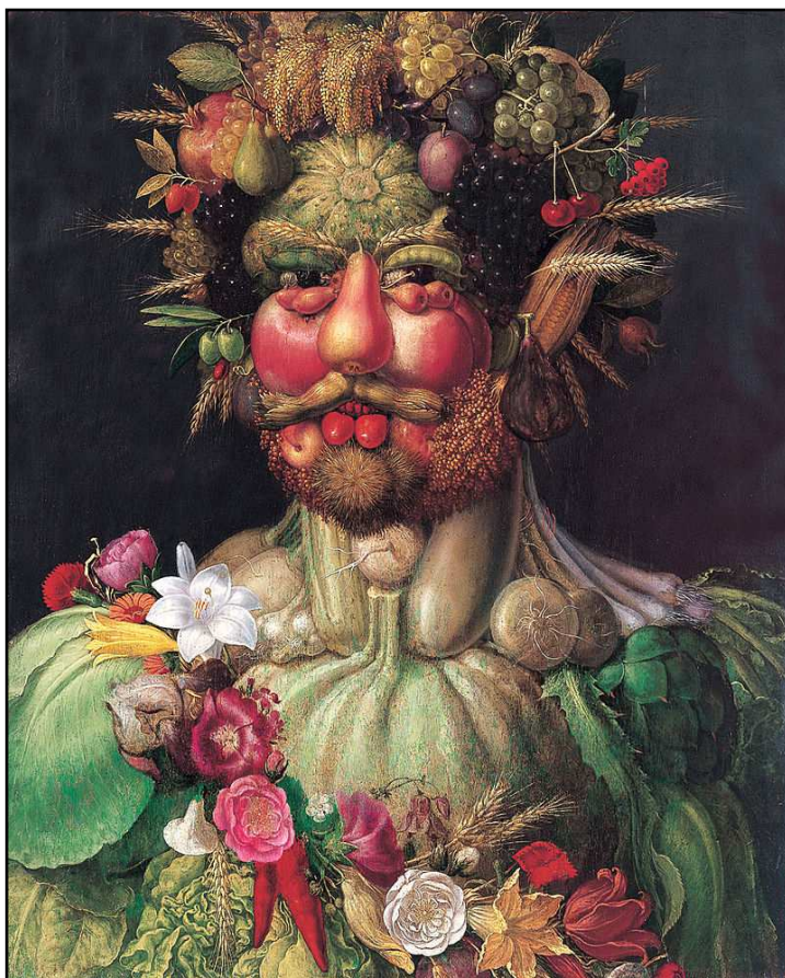
Giuseppe Arcimboldo (1527-1593)

Interpreta esta obra en collage, utilizando las ceras y los rotuladores, variando las formas e incorporando diferentes texturas. El soporte debe tener un tamaño DIN A4 y adecuarse a la técnica.