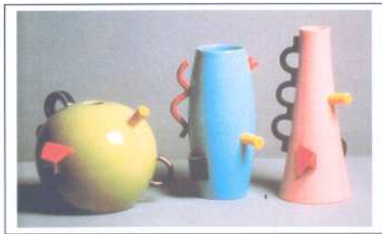
OPCIÓN B Combinación de jarrones decorativos.