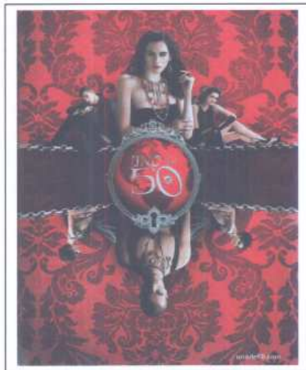
OPCIÓN C Página publicitaria "Uno de 50" Firma de joyas y accesorios. 2008.