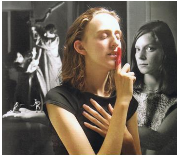
Ouka Lele: El silenci , 2003 Ouka Lele: El silencio , 2003