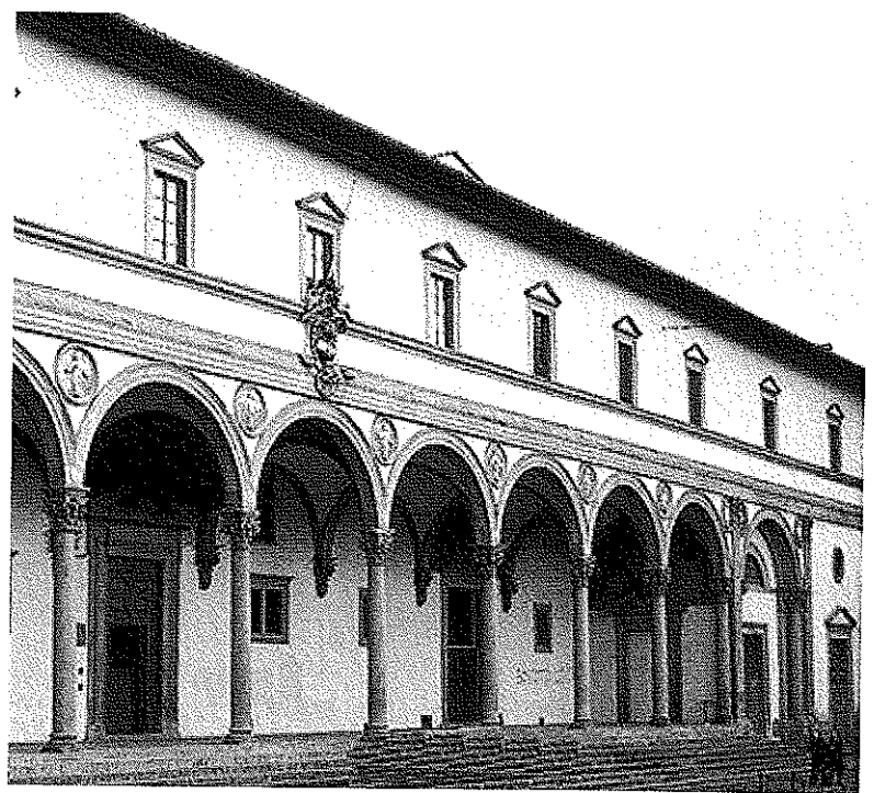
OPCION 1. IMAGEN 2 Brunelleschi. El hospital de los inocentes